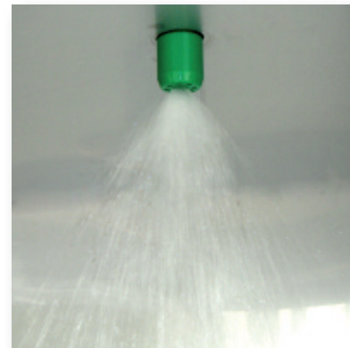
Hochleistungsduschkopf für Tanknotduschen (40 Liter / Minute - Klasse I)