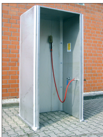
BR 926 005

Dimensions (HxIxP): 2580 x 1100 x 1100 mm Branchement d'eau: 1/4" /f